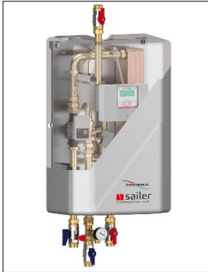
Abbildung 2: Wärmeübergabestation